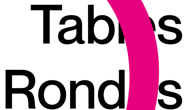
Table ronde 1

Thème: Présenter ses documentaires de manière attractive