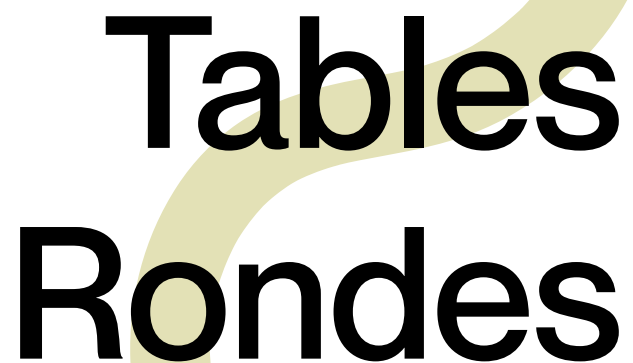
Table ronde 1

Thème : Échanges autour du logiciel NetBiblio